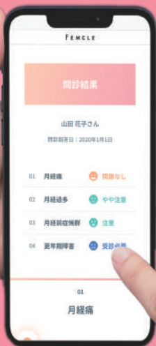
問診結果イメージ

アンケート型オンライン問診・書き込み相談などを実施 全年代の女性の健康を、無料でサポートします