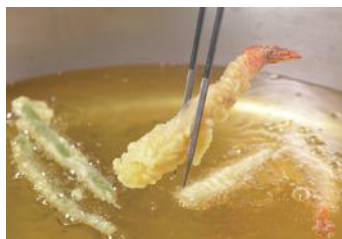
サクサクの揚げたて天ぷら♪