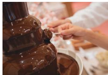
人気のチョコレートファウンテン♪