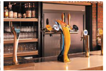
飲み放題はバーカウンターでの提供です。