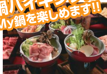
お好きな具材でお好きな鍋を