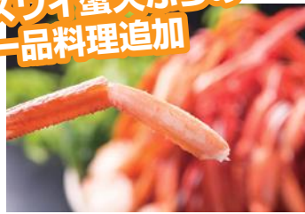
ゆでズワイ蟹は食べ放題♪