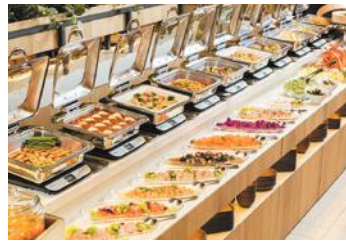
色鮮やかなお料理の数々