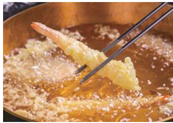
サクサクの揚げたて天ぷら♪