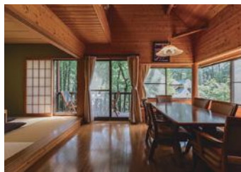
ハイグレードコテージ8,100円!!