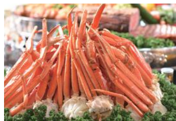
山盛りの蟹を思う存分♪