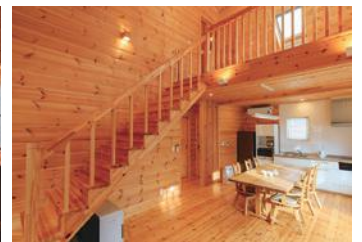
トップグレードコテージ9,100円!!